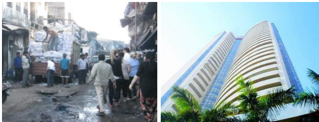
Dharavi und Börse

Mumbai hat über 12 Mio. (mit Vororten 18 Mio.) Einwohner und ist damit die größte Stadt Indiens und eine der größten Städte der Welt. Als „Wirtschaftshauptstadt“ Indiens ist sie auch das internationale Zentrum des Landes. Ein Drittel der nationalen Einkommenssteuer und fast 2/3 aller Zoll-Einnahmen stammen aus Mumbai. Die Börse „Bombay Stock Exchange“ ist die älteste Asiens, und die Filmindustrie („Bollywood“) größer als die von Hollywood. Mumbai gilt als eine der sichersten Großstädte der Welt.