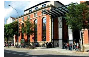
Université de Strasbourg