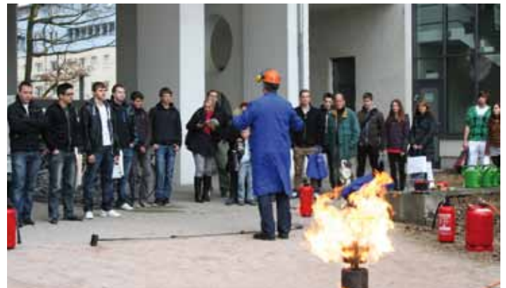
Feuerlöschübung mit dem Institut für Arbeits- und Sozialhygiene (IAS)

Nächster Tag der offenen Tür: 16. März 2013