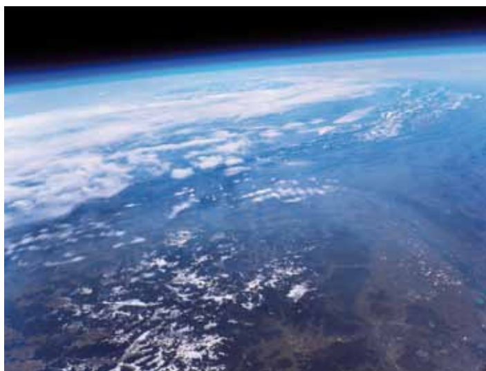
links unten Südschwarzwald mit Titisee und Schluchsee, rechts unten Freiburg, dahinter der Rhein und das Juragebirge und oben über der dünnen Atmosphärenschicht der tief-schwarze Weltraum.

D er Studiengang Elektrotechnik ließ am Tag der offenen Tür auf dem Sportgelände hinter dem Gebäude wieder einen Wetterballon los. Der Start eines Wetterballons hat an der DHBW Karlsruhe Tradition. In den vergangenen fünf Jahren wurden bereits zehn Ballons gestartet, oft als