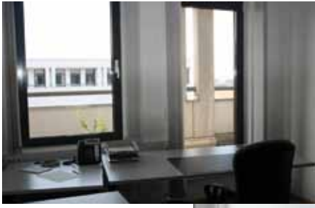
Familienzimmer der DHBW Karlsruhe