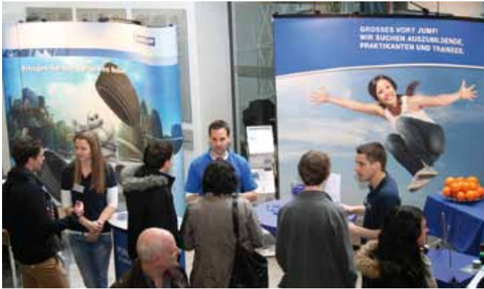
Studierende der Partnerunternehmen beraten interessierte Schüler und Eltern