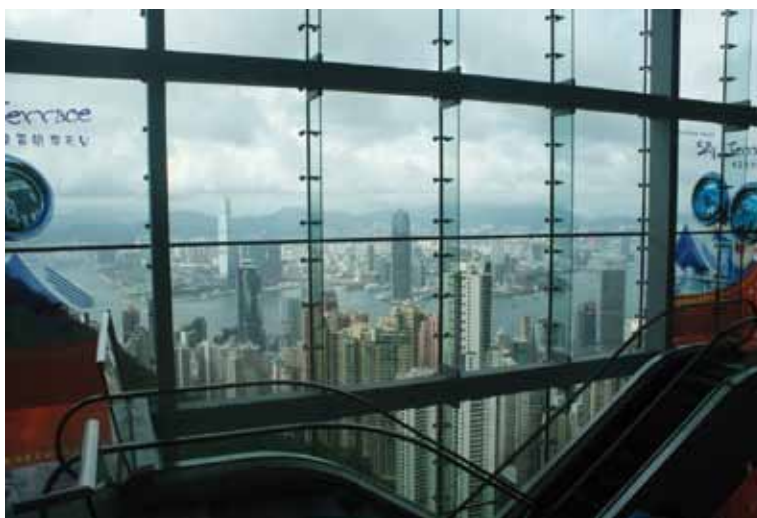
Peak Tower, Blick auf Hongkong