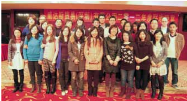
„Chinese New Year“ in Shenzhen: Jahresfeier mit chinesischen Kollegen

Aus meiner Schulzeit kannte ich noch ein paar Worte Mandarin, und um mich vorzubereiten, sammelte ich Informationen von Arbeitskollegen und arbeitete mich durch Literatur über China. Vor Ort war es dann doch ganz anders: Wenn