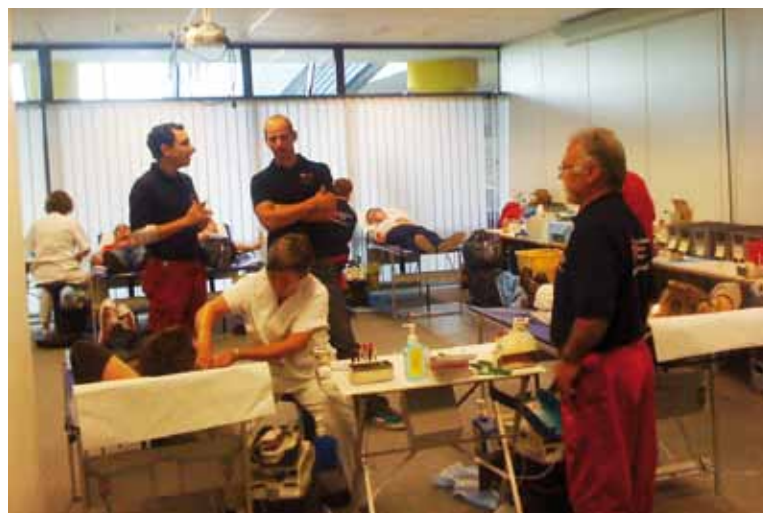
11. Juni 2012: Blutspendetag an der DHBW Karlsruhe