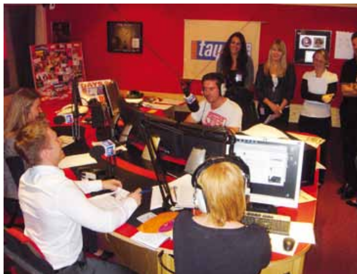
In speziellen Gruppenprojekten gewinnen die Studierenden des Studiengangs BWL-Handel neue Perspektiven. So z.B. bei der Entwicklung einer Marketingstrategie für tay-FM, einem Radiosender der Bauer Media Group in Dundee (Großbritannien).

Die Globalisierung des Handels gewinnt immer stärkere Bedeutung sowohl auf der Beschaffungs-, als auch Absatzseite. Deshalb wird an der DHBW Karlsruhe nicht nur eine Vertiefung „Internationales Handels- und Dienstleistungsmanagement“ angeboten, sondern auch vielfältige Möglichkeiten für Studien im Ausland. Zusätzlich zur Option, individuell ein Theoriesemester an einer Universität im Ausland zu absolvieren, werden